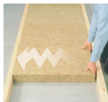
Подожмите пружинящий край и вставьте другую сторону