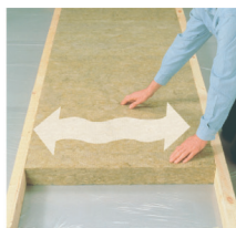
Отпустите плиту и она плотно встанет в каркас