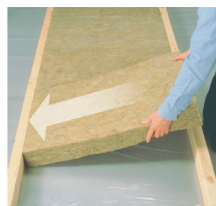
Вставьте плиту одной стороной в каркас

Плиты ЛАЙТ БАТТС с технологией Флекси легко установить в каркас благодаря наличию пружинящего края. Плиту не нужно «подгонять» в конструкцию. Достаточно поджать такой край и плита встает на место, кроме того, компенсируя возможные отклонения от вертикали. Пружинящий край имеет маркировку на торце.