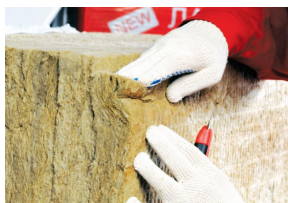
Пружинящий край поджимается и разжимается

Плиты ЛАЙТ БАТТС с технологией Флекси плотно встают в конструкцию каркаса, что позволяет избежать образования «мостиков холода» — между утеплителем и каркасом не образуется щелей. Благодаря этому законченная конструкция надежно удерживает тепло, обеспечивая комфортную атмосферу в помещении и отсутствие сквозняков.